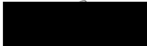
CFO Brand New Day Bank N.V.