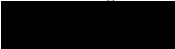
CEO Brand New Day Bank N.V.