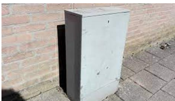
Afbeelding 3: Multitap locatie van VodafoneZiggo