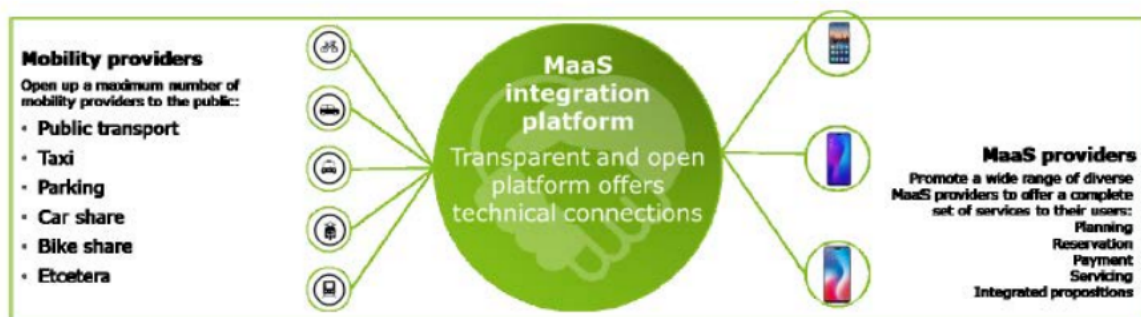
Figuur 1 Schematisch overzicht van partijen over de technische koppeling