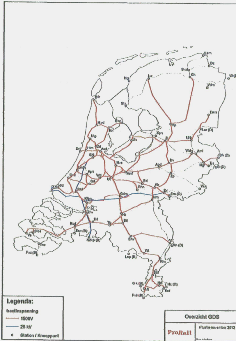
Document 7.1 Overzicht van het GDS