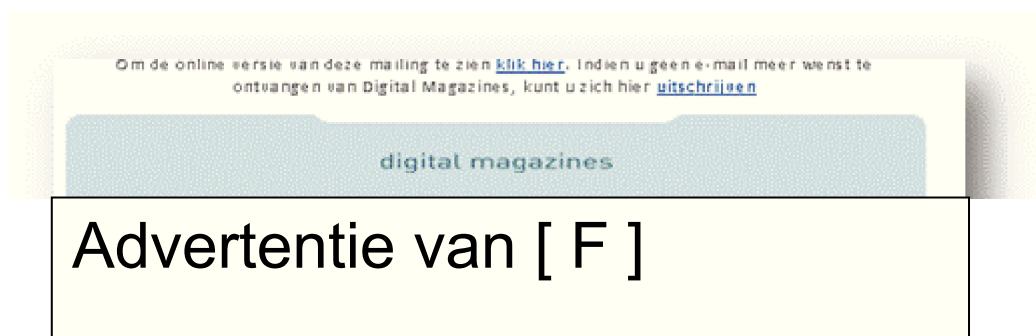
Figuur 1 Voorbeeld van een mailing, in dit geval van adverteerder [ F ]