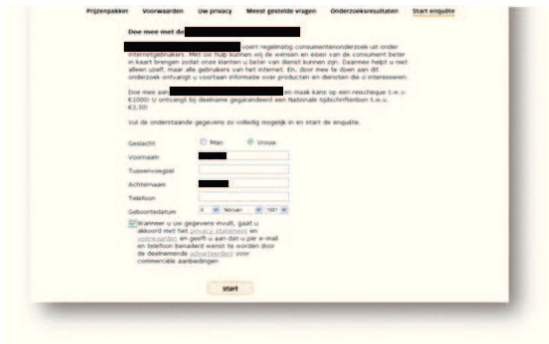
Figuur 4 Schermafdruck van voorbeeld 2 van methode B