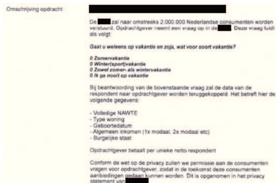
Figuur 6 Schermafdruck van methode C