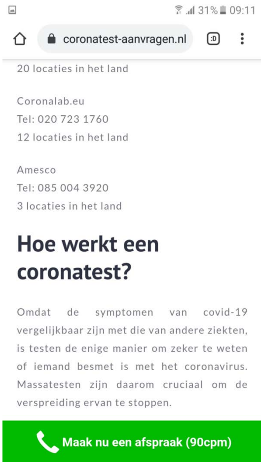
Afbeelding 5: Vastlegging mobiele website https://coronatest-aanvragen.nl d.d. 21 april 2021