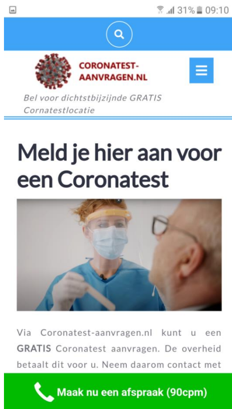
Afbeelding 3: Vastlegging mobiele website https://coronatest-aanvragen.nl d.d. 21 april 2021